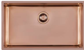
Fregadero KE Copper 2157 858